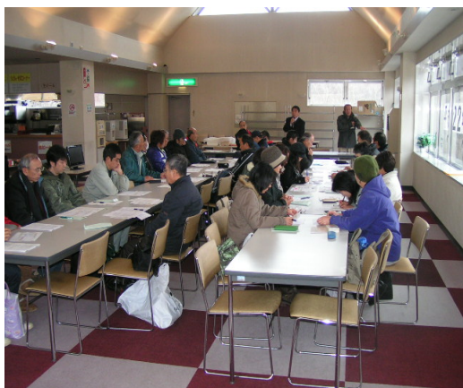
平成22年12月8日 社内研修会