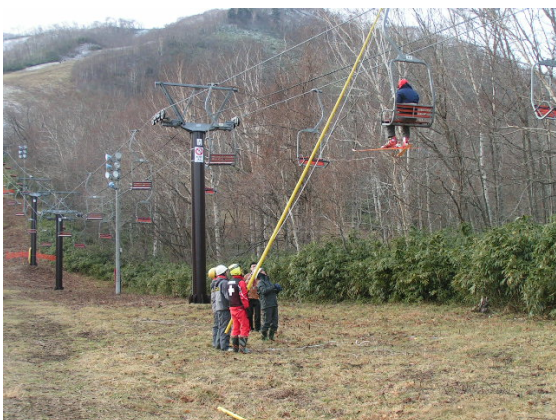
平成22年12月8日 パトロール隊員と従業員による救助訓練