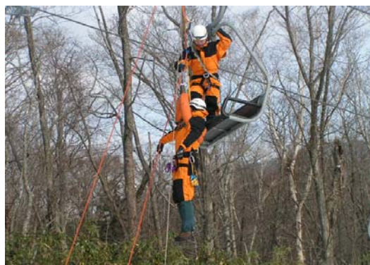
平成22年12月13日 登別消防署による救助訓練