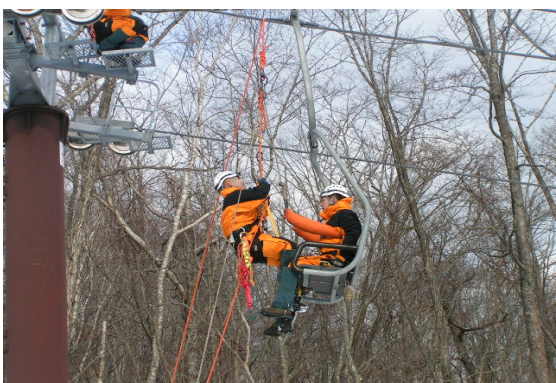
平成22年12月13日 登別消防署による救助訓練