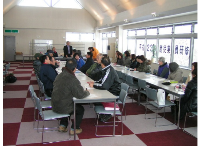
社内研修会：平成23年12月10日 【加森観光(株) 保安監査室長による講話】