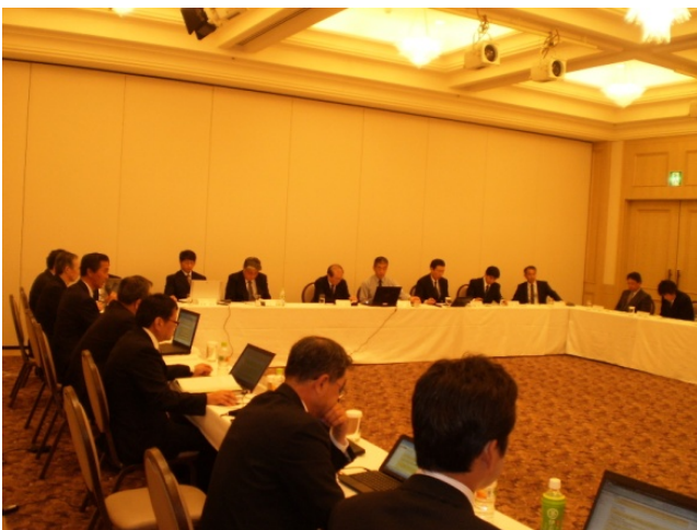
社内研修会：平成23年6月15日 【加森観光グループ索道担当者会議及び技術研修会】