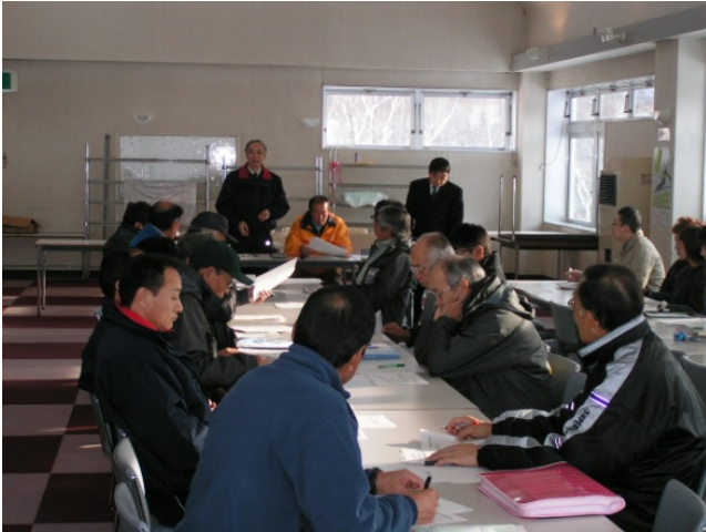
社内研修会：平成23年12月10日 【安全統括管理者による講話】