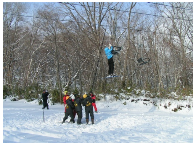
緊急時対応訓練：平成23年12月10日 【索道係員とパトロール隊員による救助訓練】