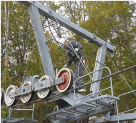
索輪点検 25. 10. 12