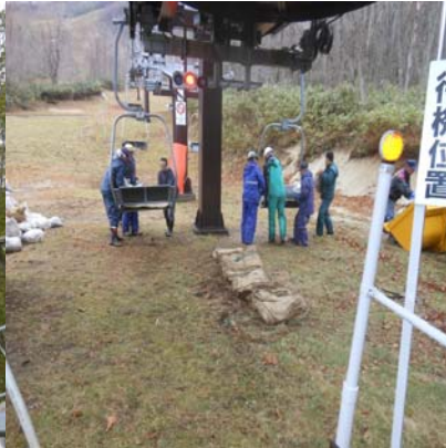
加重試験 25. 11. 15