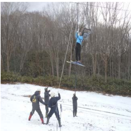
救助訓練 1回目 25. 12. 6