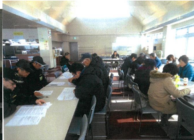
従業員研修 令和元年12月11日