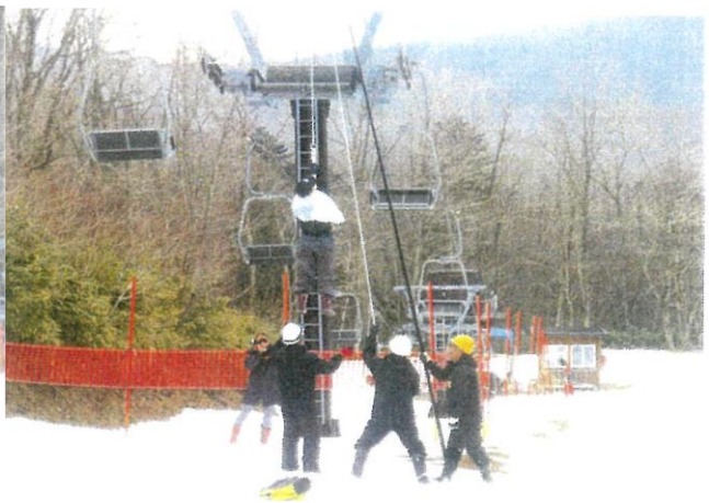
救助訓練 令和元年12月11日