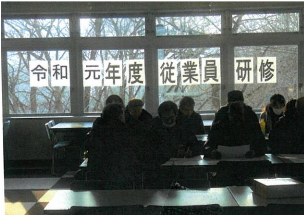
従業員研修 令和元年12月11日