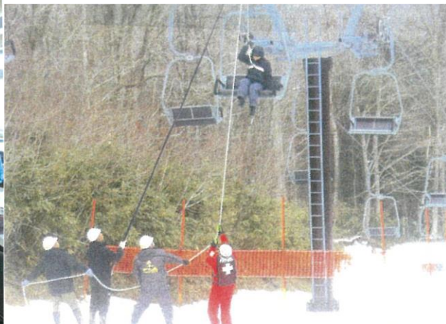
救助訓練 令和2年12月16日