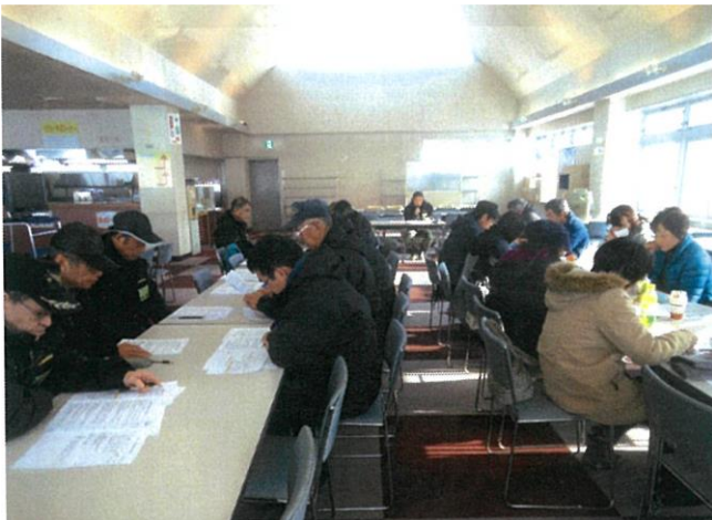
従業員研修 令和2年12月16日