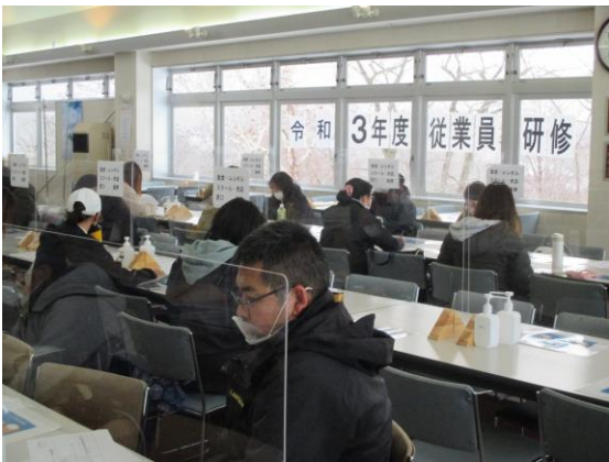
従業員研修 令和3年12月15日