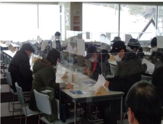
従業員研修 令和4年12月17日