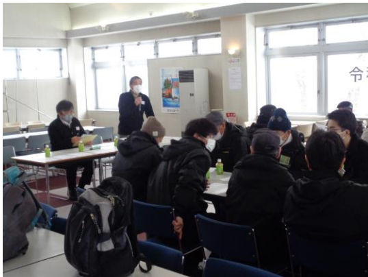
従業員研修 令和5年12月13日